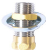
(2) Kit niples de 1/2" NPT x 1-3/4" de largo, con tuerca y arandela

SE ADAPTA A TODAS LAS MARCAS LATÓN 64238