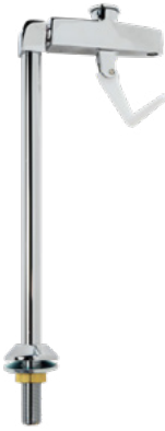
Pedestal de 10" con Llenadora de Vaso y Jarra