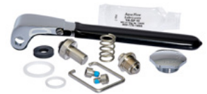
Kit de Reparación de Válvula de Pulverización

2000-0004 Kit de Reparación de Cartucho de Retención para Mano Derecha 2000-0005 Kit de Reparación de Cartucho de Retención para Mano Izquierda 3000-0000 Kit de Reparación de Cartucho Giratorio de Mano Derecha 3000-0001 Kit de Reparación de Cartucho Giratorio de Mano Izquierda