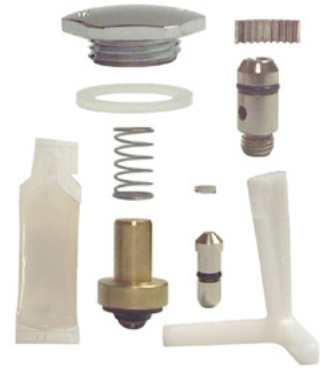
Kit de reparación de llave llenadora de vasos y jarras