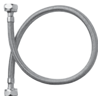
(2) Líneas de Agua de 36"