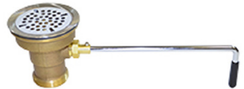
DrainKing™ Colador Plano