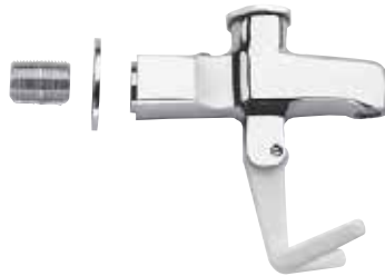
Cabeza de Llenador de Vaso y Jarra Hembra de 3/8" con boquilla cerrada de 3/8" SE ADAPTA A TODAS LAS MARCAS