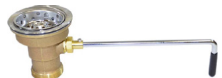
DrainKing™ Colador de Canasta